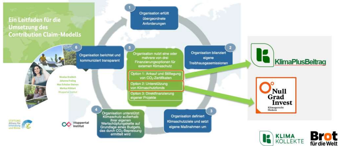
Abbildung 1: Das Contribution Claim-Modell, Folie 4

Anforderungen an Unternehmen und Organisationen